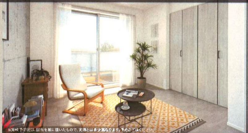
※完成予定は、図面を基に描いたもので、実際とは多少異なります。予めご了承ください。