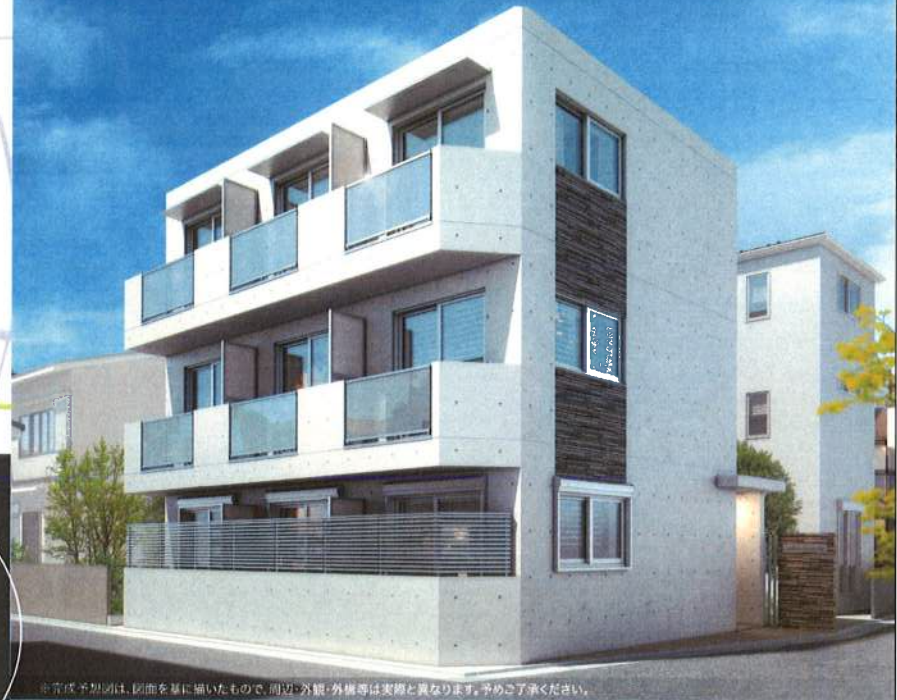
※完成予想図は、図面を基に描いたもので、周辺・外観・外構等は実際と異なります。予めご了承ください。

12月上旬入居予定 月々の家賃 69,000円 より (共益費別途 4,000円/月) 入居者募集 1R:17.28㎡(6戸)/17.96㎡(3戸)